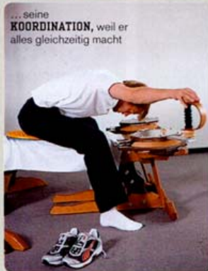
... seine KOORDINATION , weil er alles gleichzeitig macht