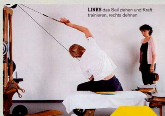
LINKS das Seil ziehen und Kraft trainieren, rechts dehnen