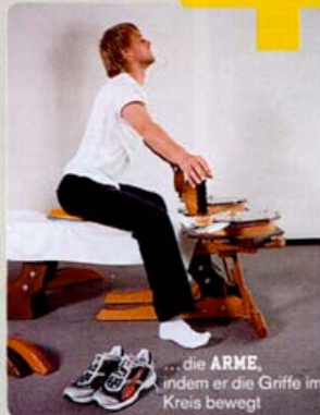
... die ARME , indem er die Griffe im Kreis bewegt