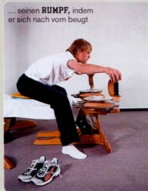
... seinen RUMPF , indem er sich nach vorn beugt